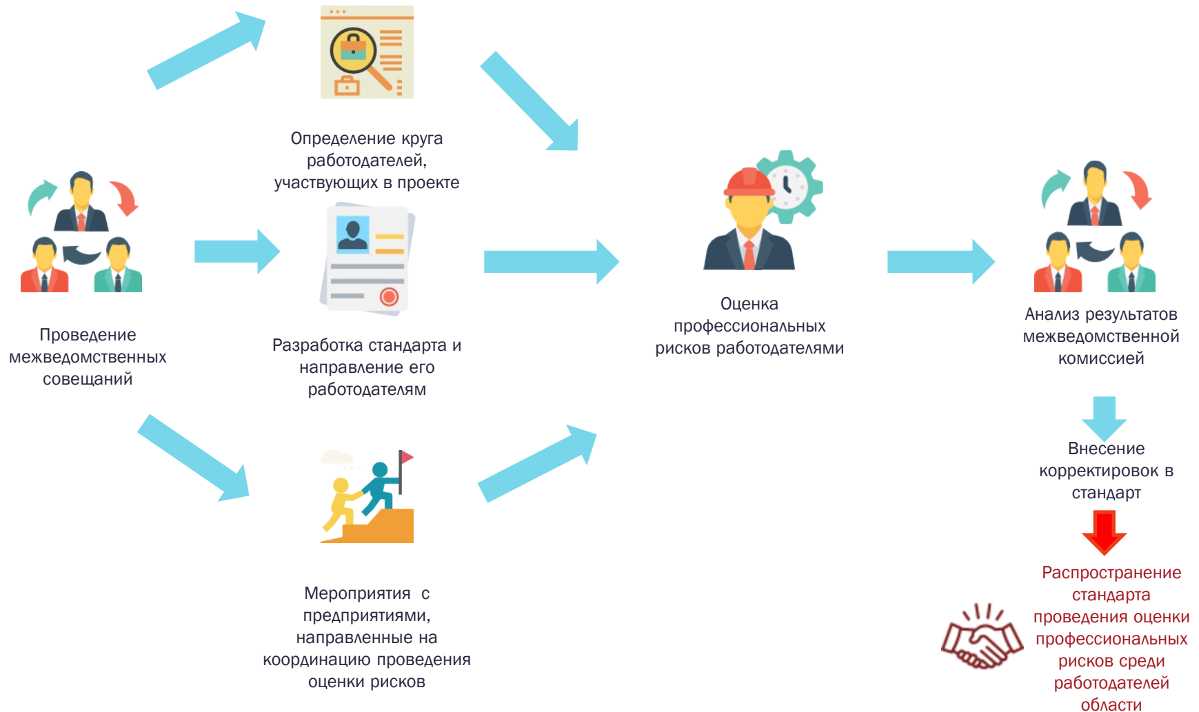
Схема работы межведомственной комиссии